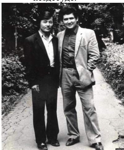
Ақын Исраил Сапарбаймен.