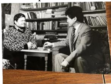
Жазушы Әуесхан Қодармен.