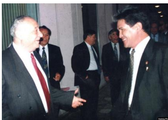
Жазушы Морис Симашкомен.