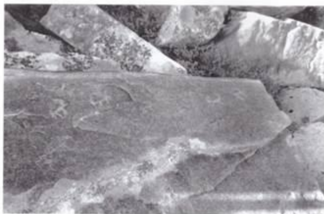
Қалғұты өңіріндегі таңбалы тас.